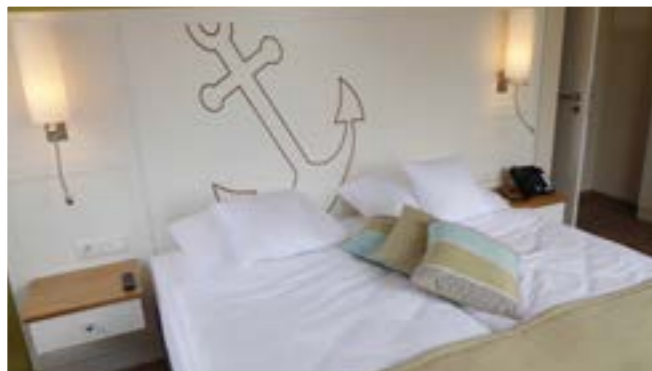
Preise pro Zimmer / Nacht 2020

Das Doppelzimmer „Ankerplatz 8“ befindet sich in der 2. Etage. Es ist zur Süd-Westseite gelegen, ca. 50m 2 groß und komfortabel ausgestattet mit Wohnbereich mit gemütlicher Sitzecke, separatem Schlafzimmer mit Doppelbett, Flachbild-TV, Safe, Minibar und Bad mit Dusche, freistehender Badewanne und WC. Ein flauschiger Bademantel und Frotteeschuhe liegen für Ihre Ferienzeit bereit.